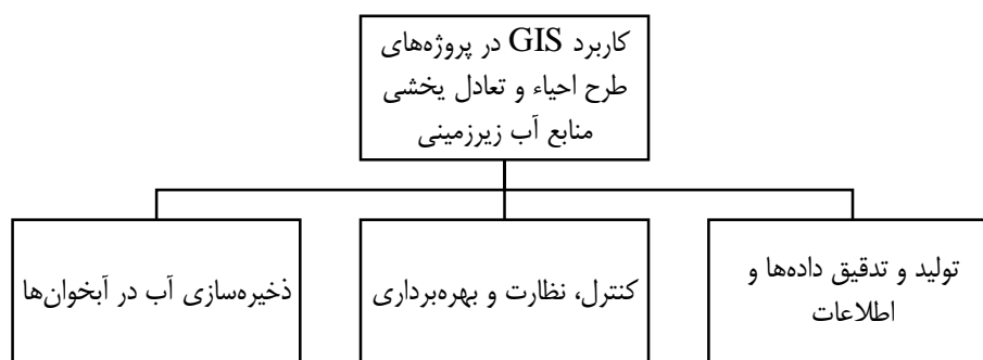
شکل ۲. سه فرآیند اساسی GIScience در پروژه‌های طرح احیاء و تعادل بخشی منابع آب زیرزمینی