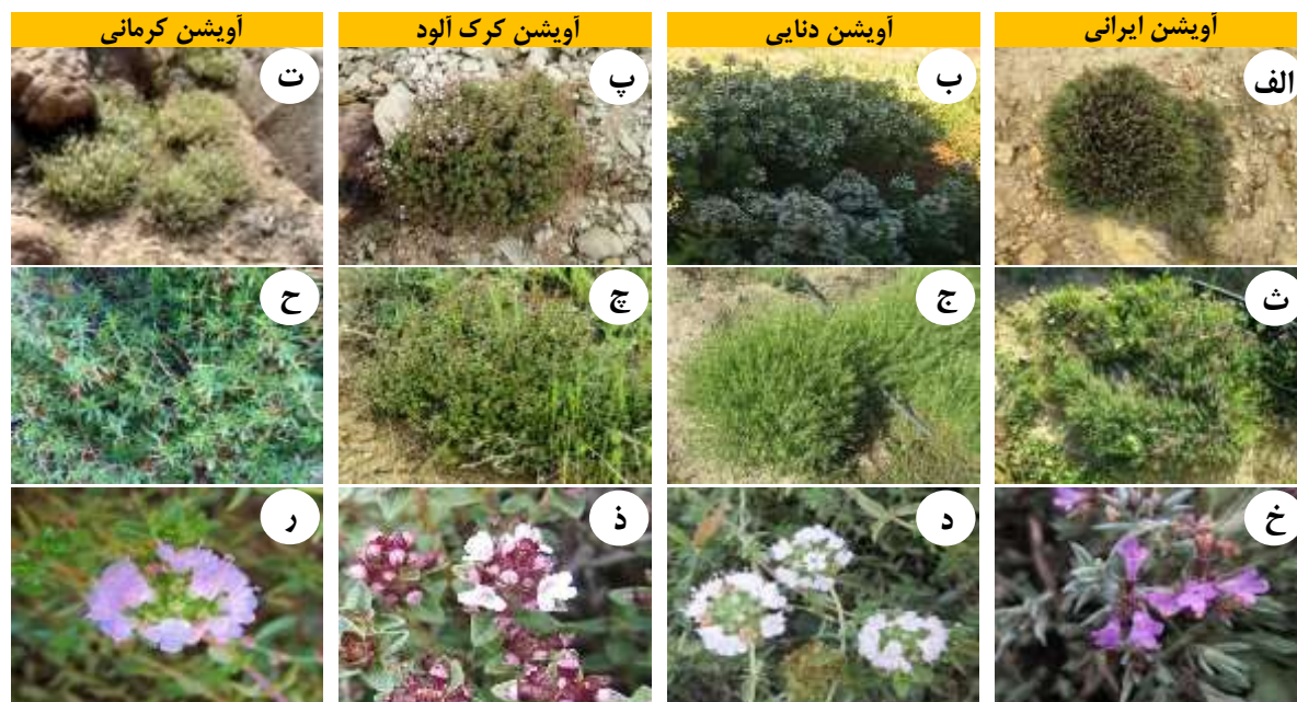
شکل ۲. تصویر گونه‌های آویشن مورد مطالعه: (الف-ت) رویشگاه، (ث-ح) منطقه کشت خارج رویشگاه و (خ-ر) در مرحله گلدهی.

دست آمد. بافت خاک در مناطق رویشی تمام گونه‌ها لومی شنی، لایه زمین‌شناسی (Geological substratum) آهکی و اسیدیته (pH) آن قلیایی بود. بر اساس تحقیقات محلی برداشت بی‌رویه و غیراصولی از گونه‌های آویشن‌دنیایی و آویشن‌کرمانی صورت می‌گیرد. بعلاوه خاک مناطق رویشی آویشن ایرانی و آویشن کرک‌آلود در حال بهره‌برداری است که موجبات تخریب زیستگاه این دو گونه را فراهم می‌کند (جدول ۲).