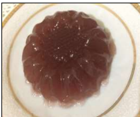
شکل ۲. ژله خوراکی رنگی تهیه شده از کارائینان استخراجی از ماکروجلبک H. flagelliformis با حفظ رنگدانه‌ی طبیعی